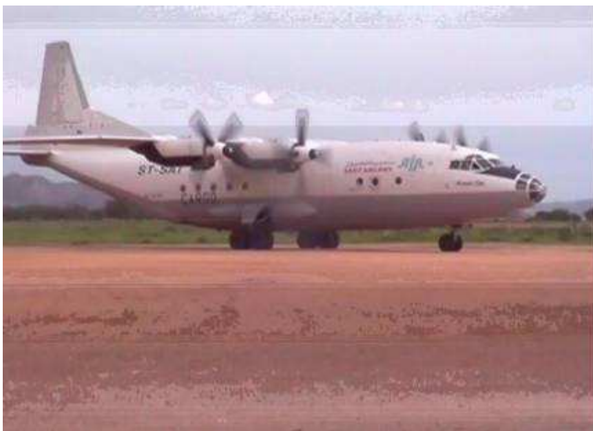
(onze Antonov in Kadugli-West)