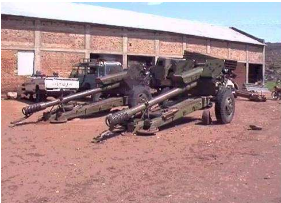
(teruggetrokken geschut in het 302 Bataljon in Kadugli)

Na een korte, spectaculaire rit tussen de strohutten door, krijgen we één van de daders te pakken. Het blijkt een jongen van misschien net een jaar of tien. Na een vermanende preek leveren we hem over aan de inmiddels in groten getale toegestroomde buurtbewoners, die de bestraffing van de angstige dader op lokale, niet zachtzinnige wijze van ons overnemen. Bij de achtervolging blij ik enige elektriciteitsdraden met de vlaggenstok van de auto te hebben meegenomen en met excuses worden deze aan de gedupeerden terug gegeven.