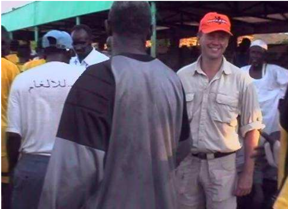
(verjaarsfeestje in het stadion)

Hierna wordt het een gezellige chaos met locale muzikanten op het veld en mijn alcoholvrije verjaarspartijtje op de tribune. Als ook de rest van het publiek de feestelijkheden van nabij wil meemaken, worden ze door enkele ordebezoekers wegnippend, maar dat is hier heel gewoon.