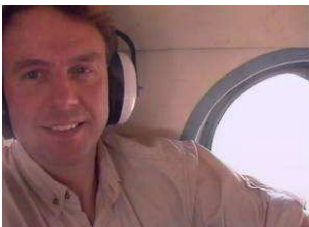
(Boven de woestijn, tussen Khartoum en El Obeid)

dag zijn monteurs op het vliegveld bezig om de motor uit een andere MI8 te verwijderen. Om drie uur gaan we naar het vliegveld, maar ons vrachtje staat nog niet klaar. We komen in tijdnoed, want het is drie uur vliegen en voor zonsondergang moeten we in Tillo zijn. Alleen in noodgevallen vliegen we in het donker. We besluiten de motor achter te laten. Het inladen op het vliegveld en uitladen in de woestijn zal zeker te lang duren. Dat moet morgen maar met een truck gebeuren. Om half vier maakt de tweemotorige Russische helikopter zich los van het zinderend hete vliegveld. De twee vliegers en een mecanicien uit de Oekraïne zitten voorin en ik nestel mij bij de open zijdeur, als een soort 'doorgunner'.