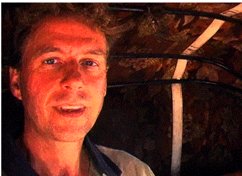
(In een riksja in Khartoum)