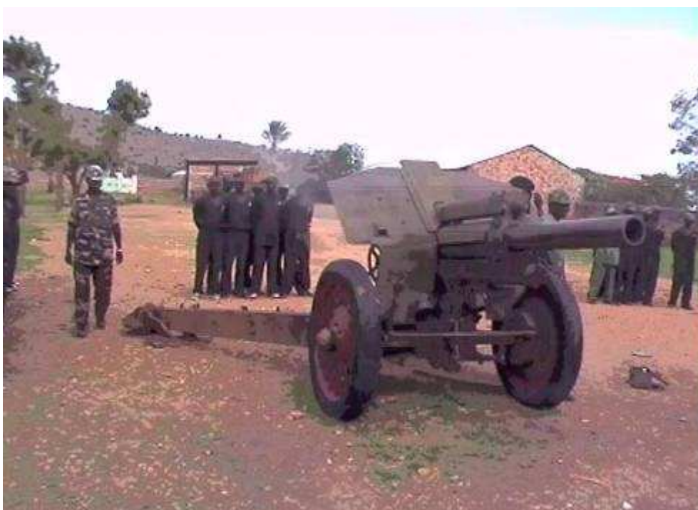
(rekruten krijgen instructie in geschut van Russische makelij uit laatste wereldoorlog)