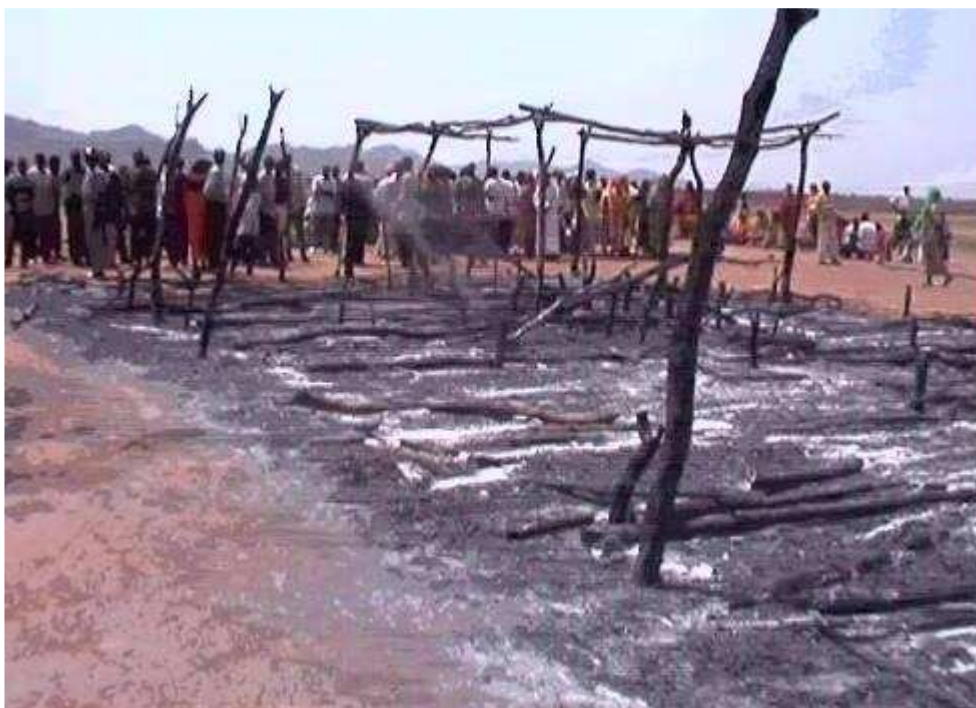
(de twee dagen voor mijn komst platgebrande kerk)

hier gebouwde kerk in brand gestoken en de mensen verdenken de chieft van het dorp. Hij heeft de gelovigen immers al enige malen bedreigd. Ik schrijf enkele bladzijden van mijn notitieboekje vol over deze inbreuk op de godsdienstvrijheid, maar ik ben niet optimistisch over het resultaat. De regering is immers druk bezig met het islamitiseren van Soedan en voor zover dit niet door de bevolking wordt gevolgd, is een zo groot deel hiervan inmiddels praktiserend moslim dat je het bouwen van een kerk in dit land kunt vergelijken met het in het verkeerde vak plaatsnemen in een voetbalstadion.