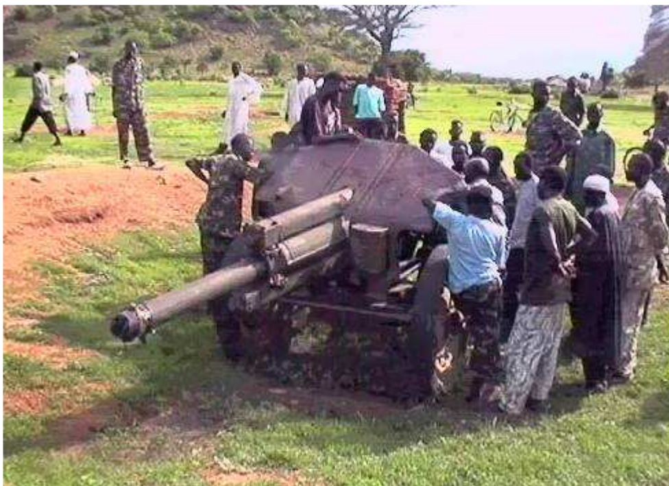
(Houwitser uit de 2e wereldoorlog in Kega)

Ik noteer het serienummer en na een klein kwartiertje geef ik onverrichte zake het vertreksein. De drie bemanningsleden brengen de enthousiaste dorpsbewoners op veilige afstand en starten de motoren. Met handen en voeten maak ik de Russische piloot duidelijk dat ik de weg wil volgen om op deze manier onze tractor te traceren. Na een tiental minuten hebben we succes en vinden het voertuig terug in een rivier. De eigenaar, zijn zoon en een drietal soldaten staan op de kant toe te kijken.