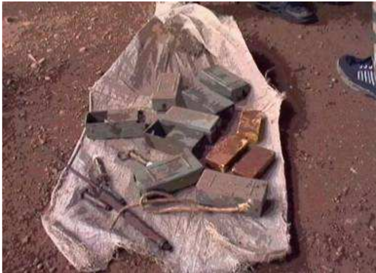
(een zakje met antipersoneel mijnen in Katcha)

We laten de soldaten achter om hun werk af te maken en gaan terug naar Tillo. De generaal is gisteren samen met een aantal nieuwe monitors en andere vakantiegangers terug gekomen van zijn verlof in Noorwegen. Het is gezellig druk in ons hoofdkwartier, mede door de aanwezigheid van het uit twee sectoren teruggetrokken personeel. Er zijn nog geen helikopters en de wegen zijn slecht, dus er wordt veel vergaderd, onder andere over de besteding van een gift van Noorwegen voor humanitaire hulp in onze sectoren. Ik beloof de generaal snel met een plan te komen, ik heb ideeën genoeg.