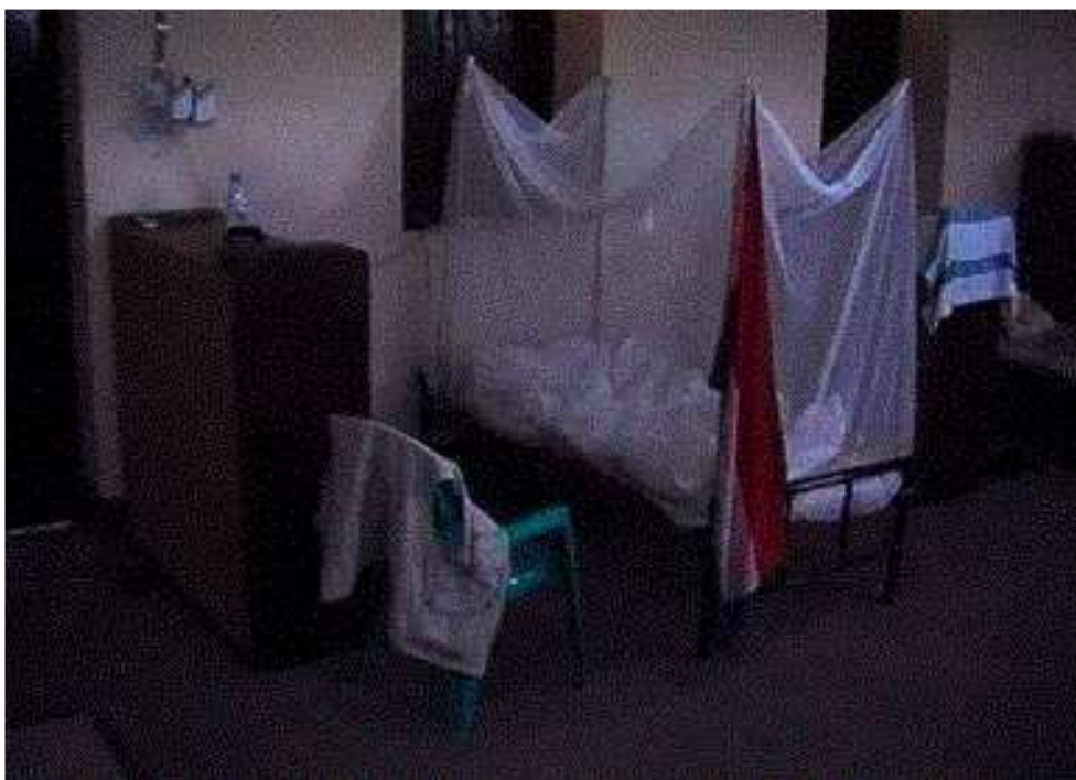
(mijn eerste logement in Tillo)

Onze compound wordt inmiddels druk bevolkt door vrijwel alle deelnemers aan deze missie, want morgen wordt er de hele dag vergaderd. Tevergeefs trachten de Britten mij te vinden voor hun travestiefestijn van de volgende avond. Deze anglosaxische liefhebberij moet vooral een Britse aangelegenheid blijven, zo nodig ondersteund door hun Amerikaanse vrienden. Zij gedragen zich immers het meest macho tijdens hun werk hier, dus nu mogen ze zich ook van een andere kant laten zien. Ik zal handhaven in mijn Hollandse waardigheid en mij hier niet aan bezondigen!