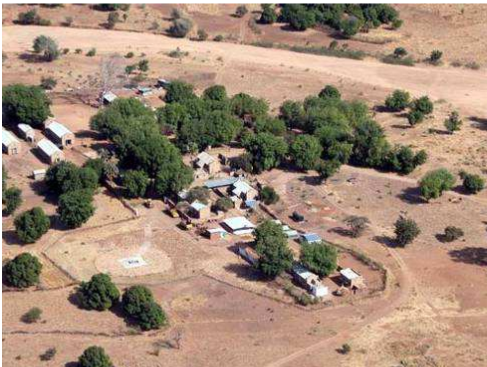
(JMC Compound Kauda)

Als we uiteindelijk willen vertrekken, weigert de heli elke dienst en omdat het al na zessen is, bereiden we ons erop voor hier de nacht te moeten doorbrengen. De wegen zijn nog niet veilig immers en daarmee niet geschikt om ons terug naar Tillo te brengen. Uit noodrantsoenen wordt een redelijke maaltijd gemaakt. In een van de gebouwen in aanbouw, staan nog wat bedden. Net als ik onderweg ben om te gaan slapen, hoor ik de motoren van de heli aanslaan. Omdat ik niet verwacht dat we in het donker gaan vliegen, reageer ik niet direct.