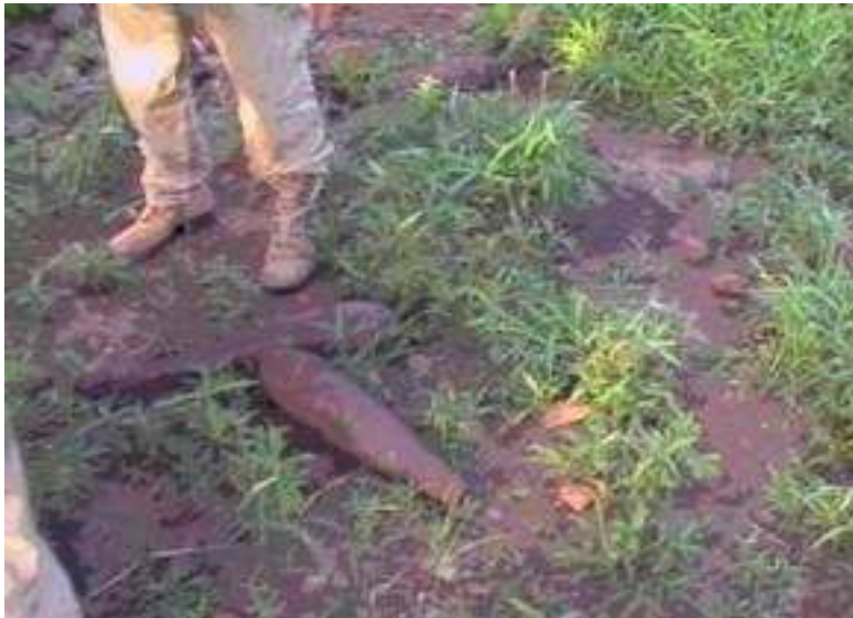
(niet ontplofte mortiergranaten in de berm)

In het garnizoen van Shatt Damam tref ik een eenzame 120 mm mortier aan, die met munitie nog steeds in stelling staat. Dit is niet de bedoeling. Volgens afspraak moet alle artillerie inmiddels teruggetrokken zijn in het artilleriebataljon in Kadugli. Morgenochtend dus direct naar de brigadecommandant. De ontvangst door de chiefs in het Shatt-gebied is allervriendelijkst.