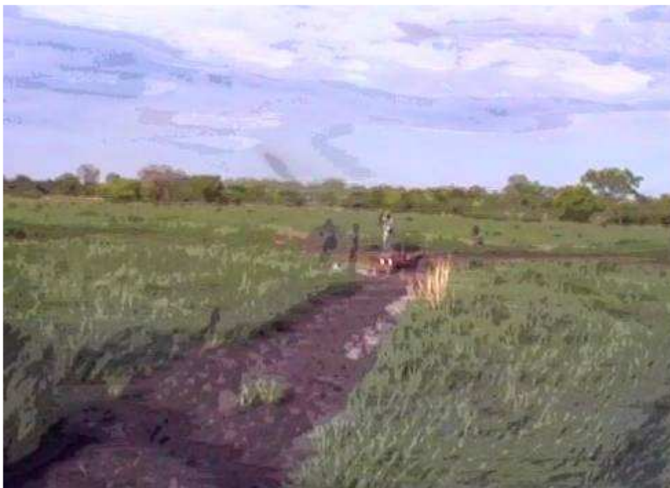
(de onfortuinlijke tractor in de rivier)