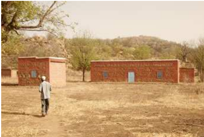
(de herstelde gebouwen in Miri Juwa)

In Miri Juwa word ik omhelsd door de bijna tachtig jaar oude, maar nog zeer kwieke chieft, die ik drie maanden niet heb gezien. Trots brengt hij me over de nieuwe weg naar de herstelde gebouwen. De weg heeft inmiddels mijn naam gekregen!