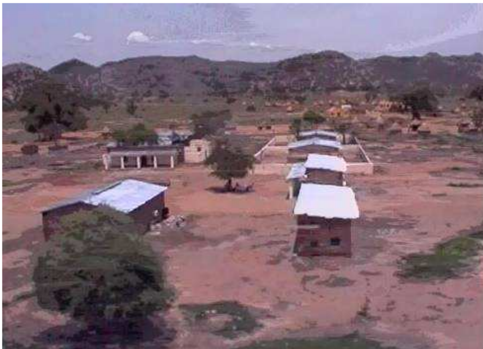
(JMC compound in Umm Sherdiba)

lastige beperking: alle wegen naar het kamp zijn gesloten voor JMC, omdat een maand geleden een auto van onze cateraar onderweg naar Umm Sherdeba op een landmijn is gereden. Uiteindelijk heeft het leger de wegen in een recordtijd en op een geheel eigen wijze op mijnen verkend (15 kilometer in twee dagen...), dus het vertrouwen in een veilige rit is nog niet voldoende aanwezig om de weg weer open te stellen. Met de helikopter gaat het echter prima. Ik ben jaloers op zijn locatie, lekker ver weg van het hoofdkwartier, maar er zijn ook veel beperkingen. Toch besluit Ronnie om op korte termijn hier zijn intrek te nemen.