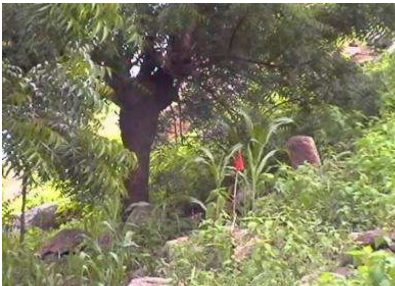
(gemarkeerd mijnenveld in Katcha)

Met anderhalf uur vertraging ga ik met twee auto's onderweg. Bij de 18de Brigade halen we enkele militairen op, die de mijnenvelden met rode vlaggen gaan markeren. In het garnizoen van Katcha aangekomen, probeer ik mijnenvelden zo goed en zo kwaad als het kan in kaart te brengen. De enige die precies wist waar de landmijnen hier liggen, is in april hierdoor om het leven gekomen... Het verhaal over acht slachtoffers verleden week kan niemand bevestigen, zodat ik het maar houd op een zestal incidenten afgelopen jaar, die zowel bij het leger als de burgers bekend zijn. Dit zijn er natuurlijk ook zes teveel. Vanaf het garnizoen naar de mijnenvelden is slechts een tiental minuten lopen, ik laat de soldaten graag voorgaan.